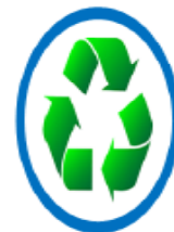
ความยั่งยืน