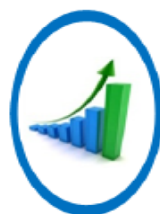
ความมั่งคั่ง