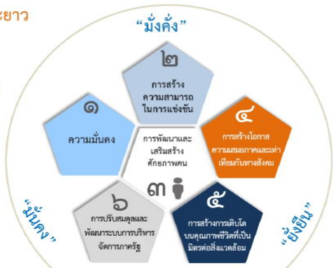
ความเชื่อมโยงของยุทธศาสตร์ชาติกับแผนในระดับต่างๆ

เพื่อให้บรรลุวิสัยทัศน์ “ประเทศมีความมั่นคง มั่งคั่ง ยั่งยืน เป็นประเทศพัฒนาแล้ว ด้วยการพัฒนาตามปรัชญาของเศรษฐกิจพอเพียง” นำไปสู่การพัฒนาให้คนไทยมีความสุข และตอบสนองต่อการบรรลุ ซึ่งผลประโยชน์แห่งชาติ ในการที่จะพัฒนาคุณภาพชีวิต สร้างรายได้ระดับสูงเป็นประเทศพัฒนาแล้ว และสร้าง ความสุขของคนไทย สังคมมีความมั่นคง เสมอภาคและ เป็นธรรม ประเทศสามารถแข่งขันได้ในระบบเศรษฐกิจ